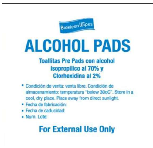
Lámina no tejida empapada en alcohol isopropílico al 70% + clorhexidina al 2%, doblada en 4 capas, dimensiones 30 mm x 30 mm y 60 mm x 60 mm (desdoblada), estéril, descartable.

Utilizado para PREINYECCIÓN / ANTISEPSIA DE LA PIEL, así como para la limpieza de conectores. Rápido y fácil de usar, y la dosificación controlada garantiza la desinfección con cada uso.