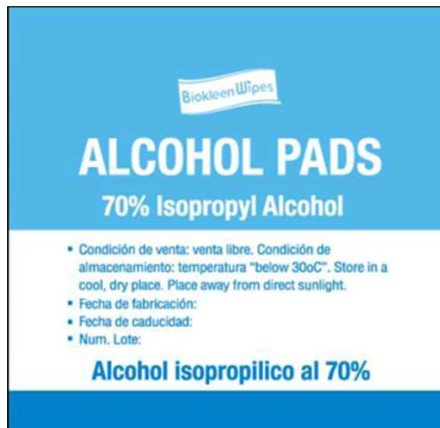
Lámina no tejida empapada en alcohol isopropílico al 70%, doblada en 4 capas, dimensiones 30 mm x 30 mm (doblada) y 60 x 60 mm (desdoblada), estéril, descartable.

Utilizado para PREINYECCIÓN / ANTISEPSIA DE LA PIEL, así como para la limpieza de conectores. Rápido y fácil de usar, y la dosificación controlada garantiza la desinfección con cada uso.